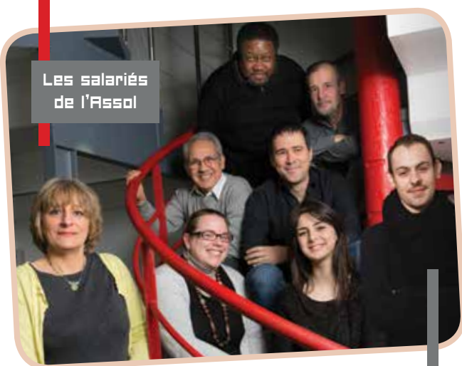
Les salariés de l'Assol

L'équipe de salariés et de bénévoles vous accueille dans ses nouveaux locaux, à Nanterre, près de la place de la Boule